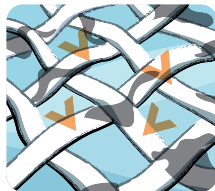
Az apróbb szennyeződéset könnyedén eltávolítják az egyéb hatóanyagok