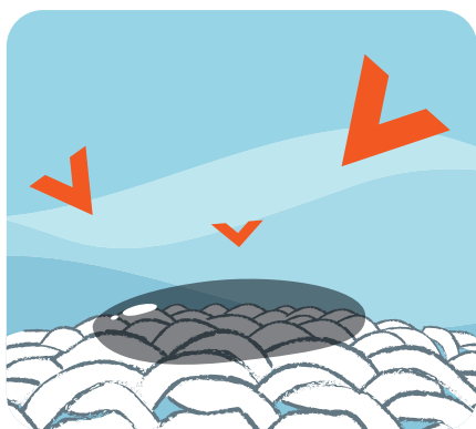
Az enzimek megtámadják a foltokat

Magas hatékonyságú összetevői kimagasló tisztítóhatást nyújtanak, és a szolgáltatóiparban keletkezett legmakacsabb foltokat is eltávolítják.